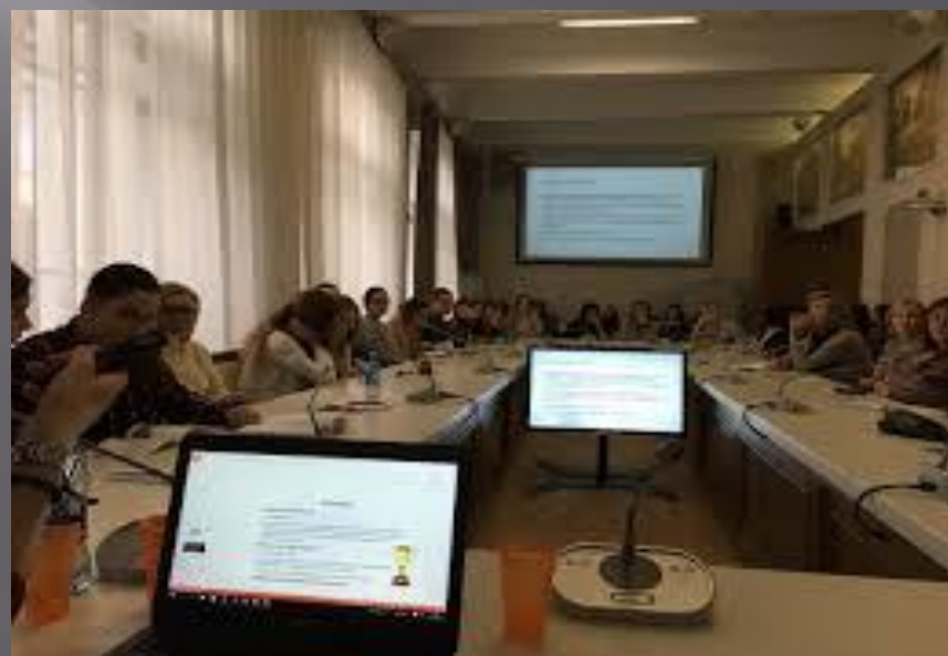
Научная библиотека Томского государственного университета