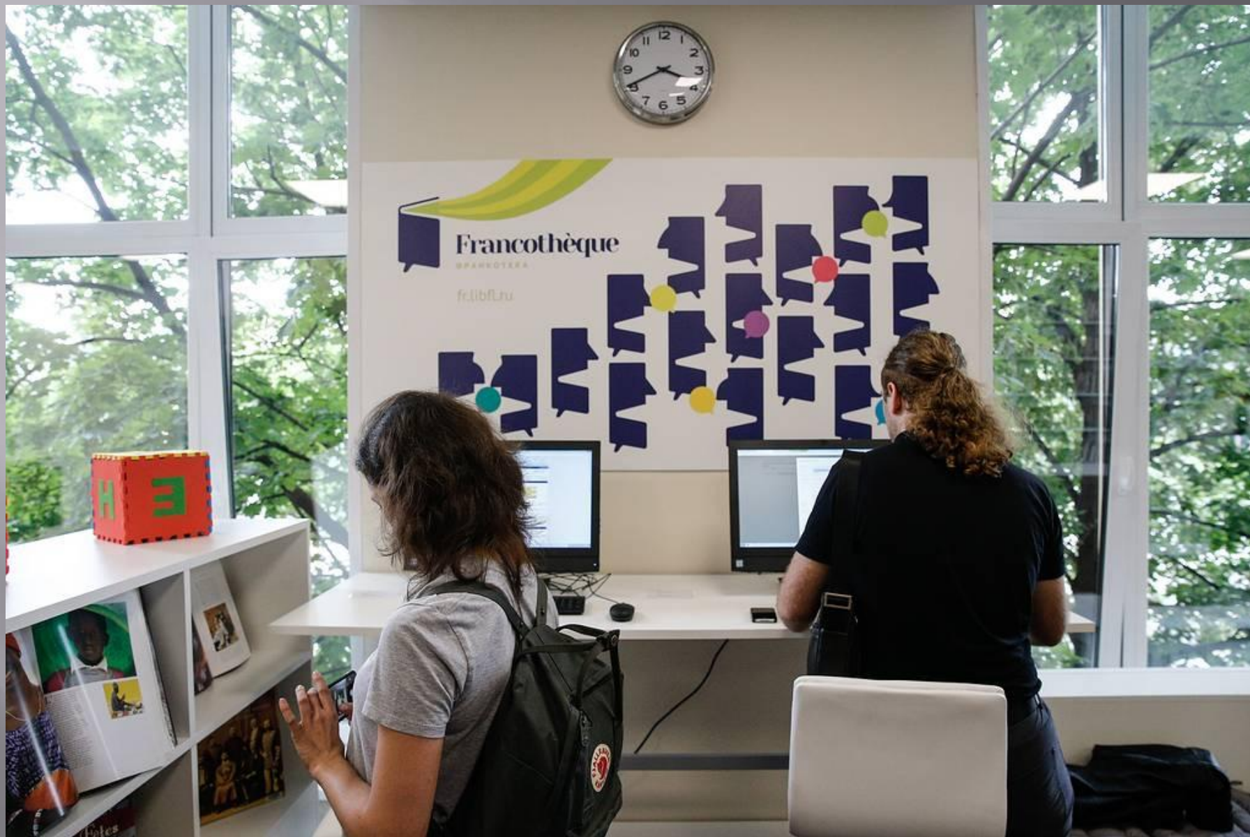
"Франкотека" во Всероссийской государственной библиотеке иностранной литературы