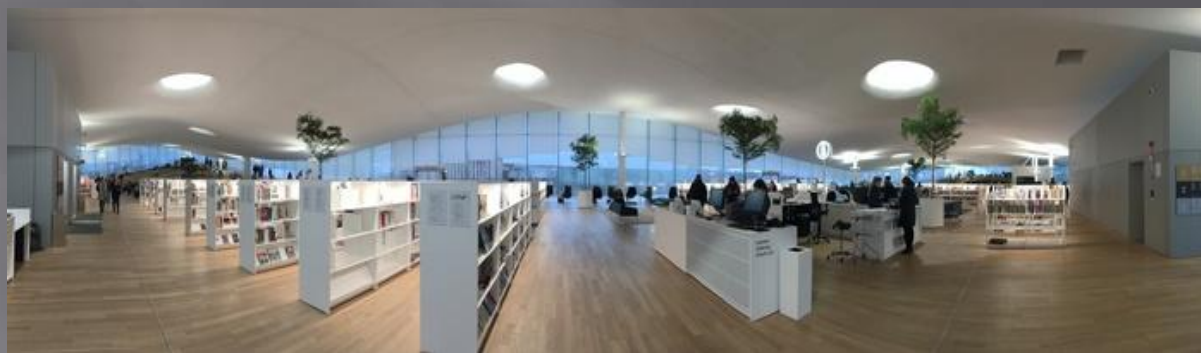
Библиотека Ооді в Хельсинки